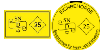
Verification marks of the Saxon verification office

Verified scales have a yellow verification mark. This is affixed to the type plate of the scale. It shows the year of the last verification. In this example: The number »25« means that the scale has been verified in 2025. Most scales must be verified every two years. The re-verification must therefore be done in 2027.