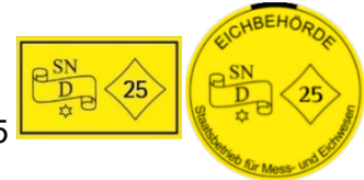
Eichkennzeichen der Eichbehörde Sachsen

Geeichte Waagen haben ein Eichkennzeichen. Das klebt auf dem Typenschild der Waage. Darauf steht das Jahr der letzten Eichung. Hier im Beispiel: Die Jahreszahl »25« bedeutet, dass die Waage 2025 geeicht wurde. Die meisten Waagen müssen alle zwei Jahre geeicht werden. Die nächste Eichung muss also im Jahr 2027 erfolgen.