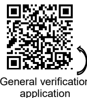
General verification application

Verification fees depend on various criteria and are regulated in the MessEGebV .