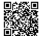
Fragen und Antworten zur Instandsetzung

In manchen Fällen muss eine Waage nach einer Reparatur neu geeicht werden. Sie können bei Ihrem zuständigen Eichamt nachfragen, ob das für Sie gilt. Wenn ja, sollte die Reparatur durch einen befugten Betrieb (»Instandsetzer«) durchgeführt werden. Dieser klebt nach der Instandsetzung ein rotes Kennzeichen auf die Waage und informiert die Eichbehörde. Dann können Sie die Waage direkt weiterverwenden. Wichtig: Sie müssen unverzüglich (innerhalb von 14 Tagen) eine neue Eichung beim Eichamt beantragen . Wenn jemand anderes die Reparatur ausführt, darf die Waage bis zur nächsten Eichung nicht weiterverwendet werden.